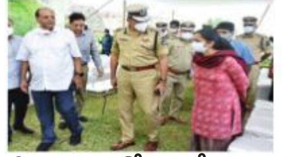
స్వాతంత్ర్య దినోత్సవ వేడుకల ఏర్పాట్లను పరిశీలించిన సీఎస్

హుజూరాబాద్ నియోజకవర్గంలోని అర్బులందరికీ డబుల్ బెడ్రూం ఇండ్లు కట్టించి అందజేస్తామని, ఆ బాధ్యతను తానే తీసుకుంటానని స్పష్టం చేశారు. రాష్ట్ర ప్రభుత్వం ప్రతి మంత్రి నియోజకవర్గంలో 4 వేల డబుల్ బెడ్రూం ఇండ్లు కట్టించేందుకు నిధులు మంజూరు చేసినా.. ఈటల రాజేందర్ ఎందుకు పూర్తి చేయలేదో అలోచించాలన్నారు.