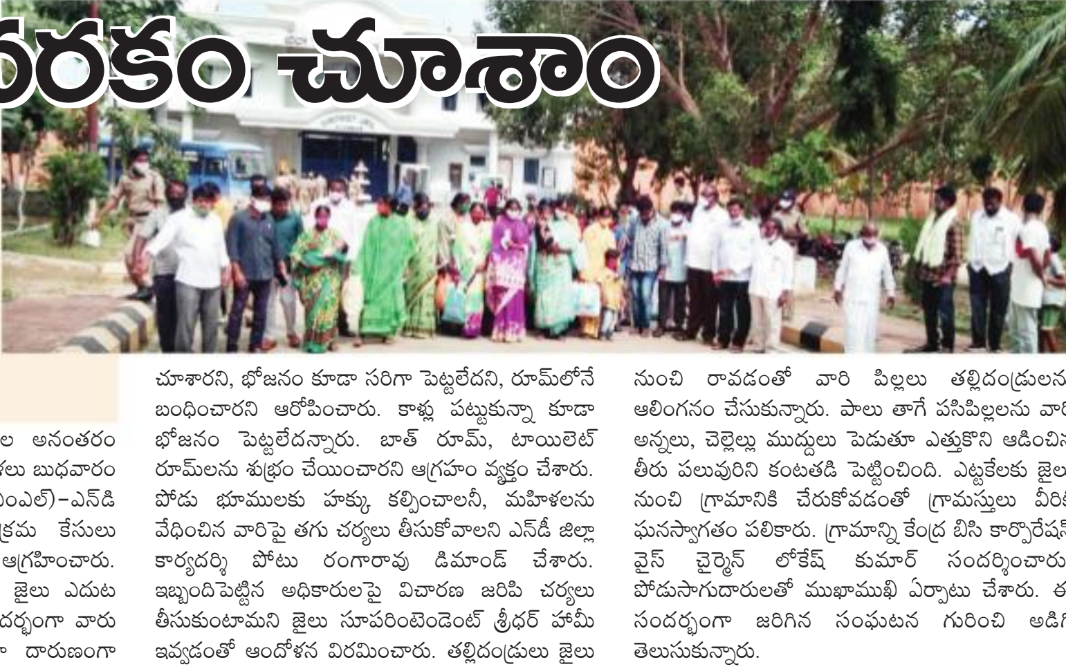
మామూరి చెలరేగింది. నాలుగు రోజుల అనంతరం చిన్నారలతో జైలు జీవితం గడిపిన మహిళలు బయటపడారు.

ప్రజాశక్తి - హైదరాబాద్ బ్యూరో ఖమ్మం జిల్లా కోణిజర్ల మండలం ఎల్లన్ననగర్ గ్రామంలోని పోడు భూముల్లో సాగు చేసేసుకుంటున్న గిరిజనులను ఫార్వెస్ట్ అధికారులు అడ్డుకోవడంతో బీజేపీ ఎమ్మెల్యే